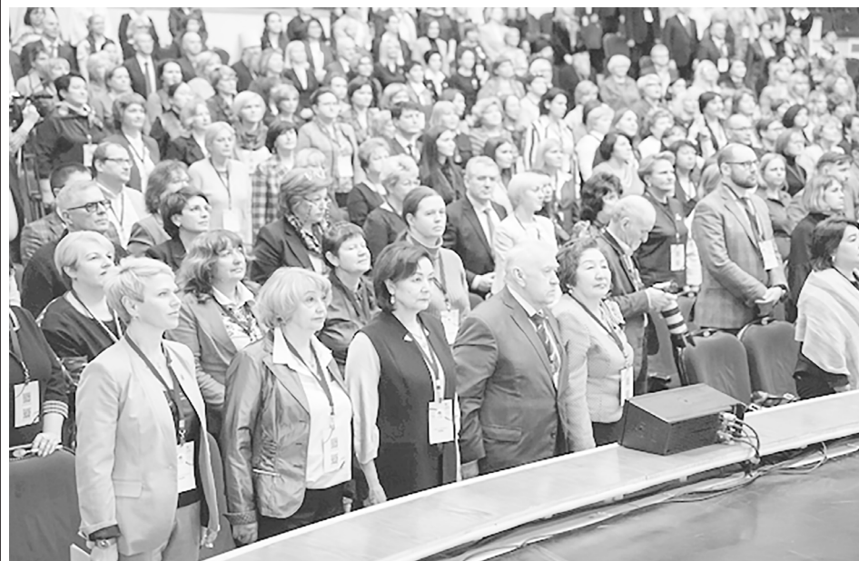
В Ярославль съехались ведущие педагоги России

Ярославль стал центром формирования новой образовательной стратегии России